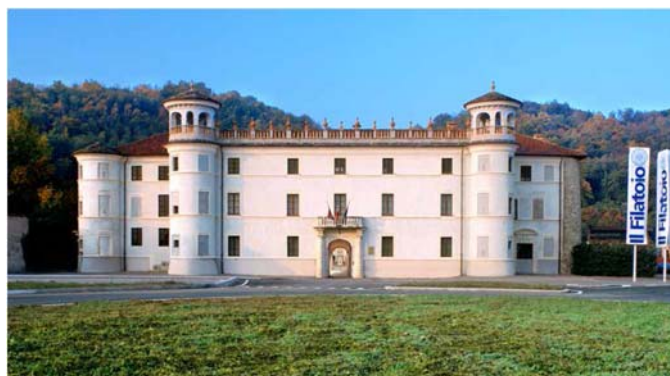
Figura 1 Il Filatoio Rosso di Caraglio (CN)