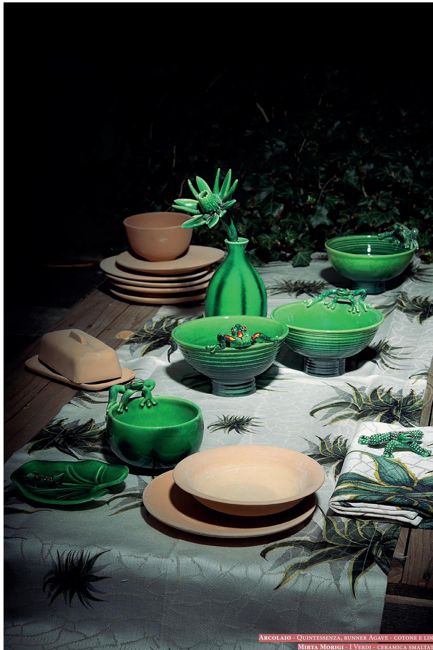
ARCOLAIO - QUINTESSENZA, RUNNER AGAVE - COTONE E LINO

melagrana s. f. [rifacimento del lat. malum granatum «mela granata» (v. lagg. granato 3 )] (pl. melagrane, raro melegrane). – 1. a. Il frutto del melograno (detto anche mela granata ): di forma sferica, con buccia coriacea di colore giallo che diventa rossastro a maturità, contiene numerosi caratteristici semi trasparenti, di color rosso rubino e di sapore acidulo. b. Ricorre spesso in similitudini: bocca, labbra di m.; rosso come un chicco di melagrana . 2. Nome con cui sono regionalmente chiamati, per il colore giallo rossastro, i granchi del genere calappa .