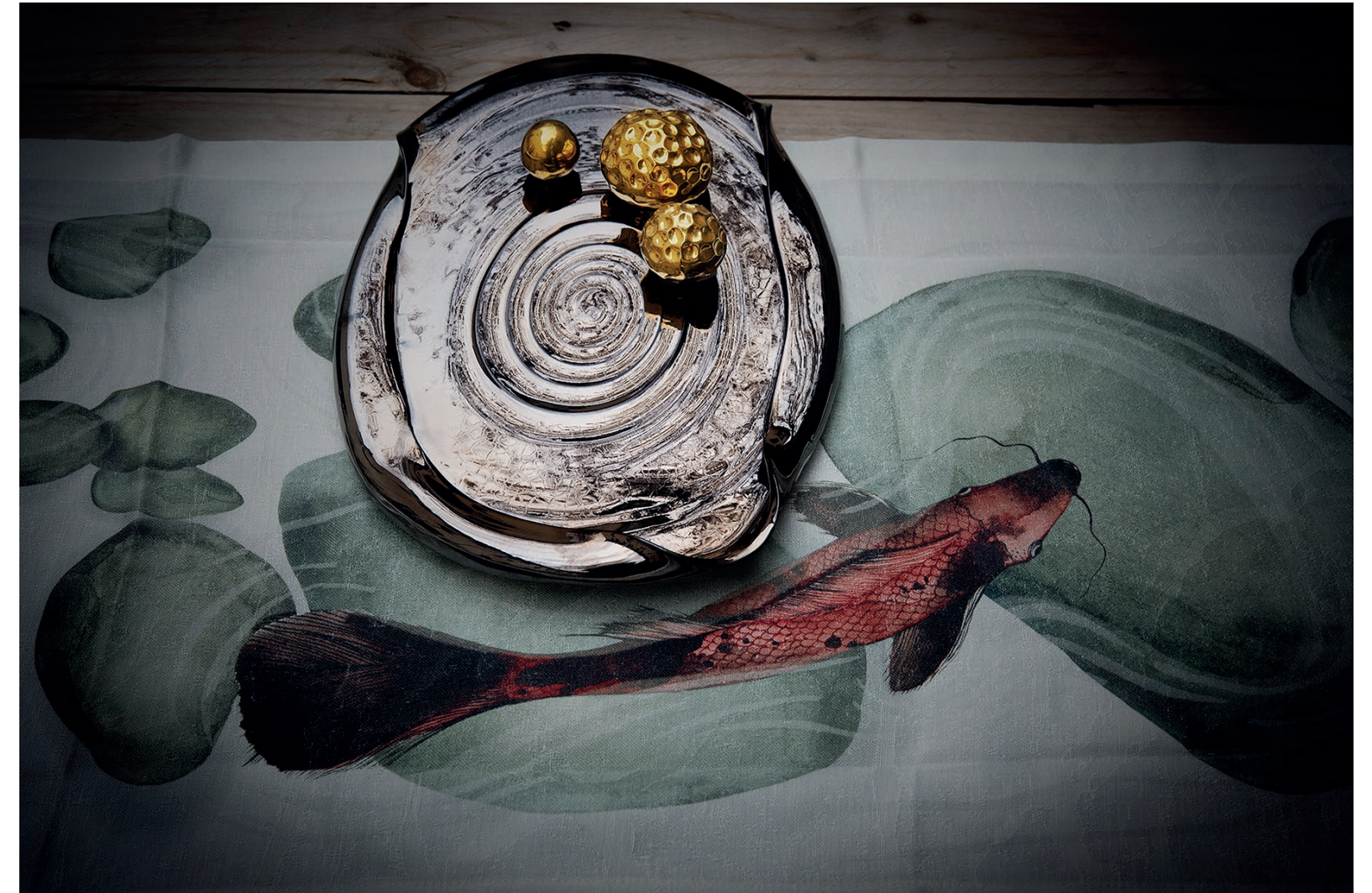
MIRTA MORIGI - FRITTELLA DORÈ - CERAMICA SMALTATA ARCOLAIO - QUINTESSENZA, TOVAGLIA CARPE - COTONE E LINO