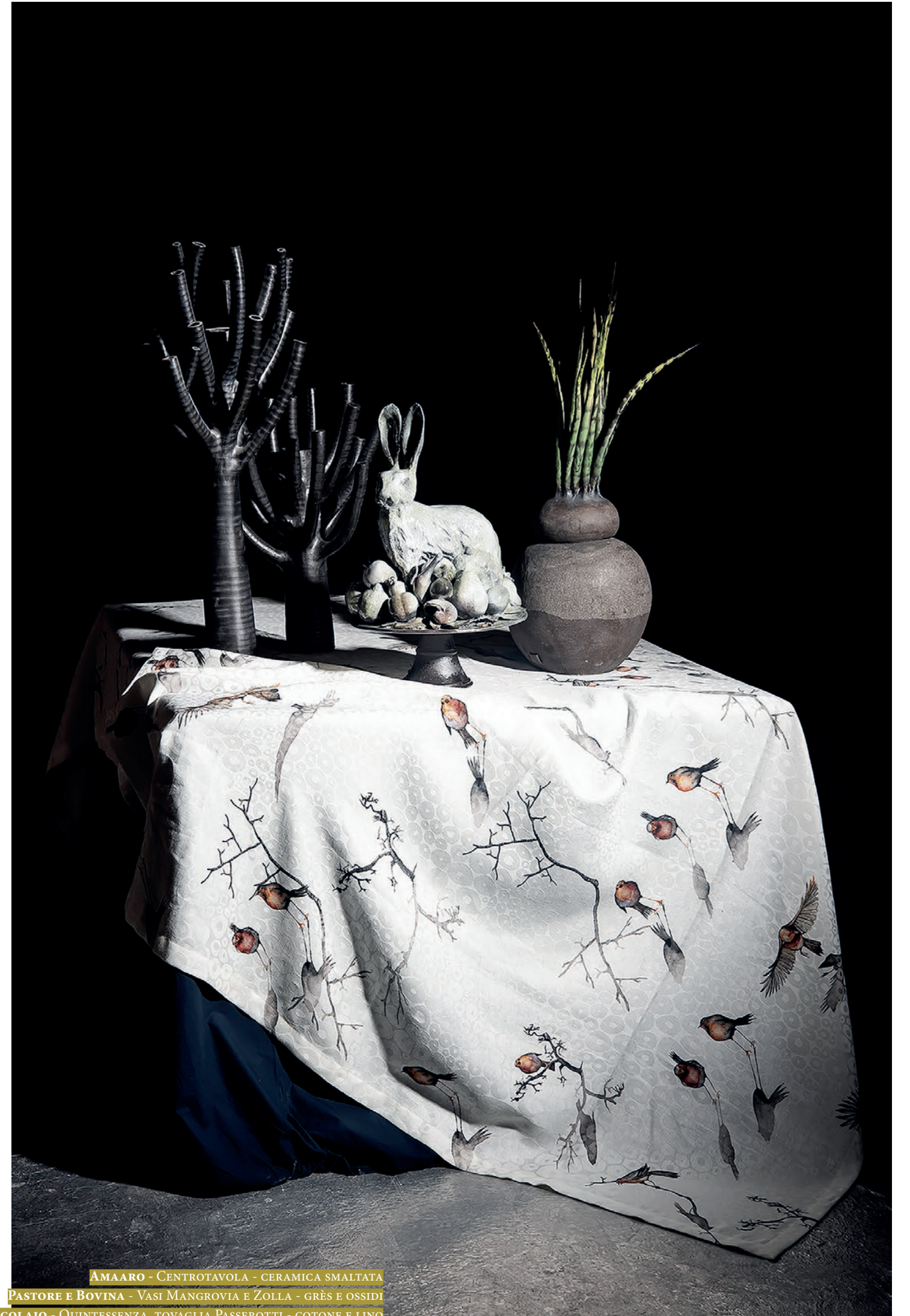
AMAARO - CENTROTAVOLA - CERAMICA SMALTATA PASTORE E BOVINA - VASI MANGROVIA E ZOLLA - GRÈS E OSSIDI ARCOLAIO - QUINTESSENZA, TOVAGLIA PASSEROTTI - COTONE E LINO