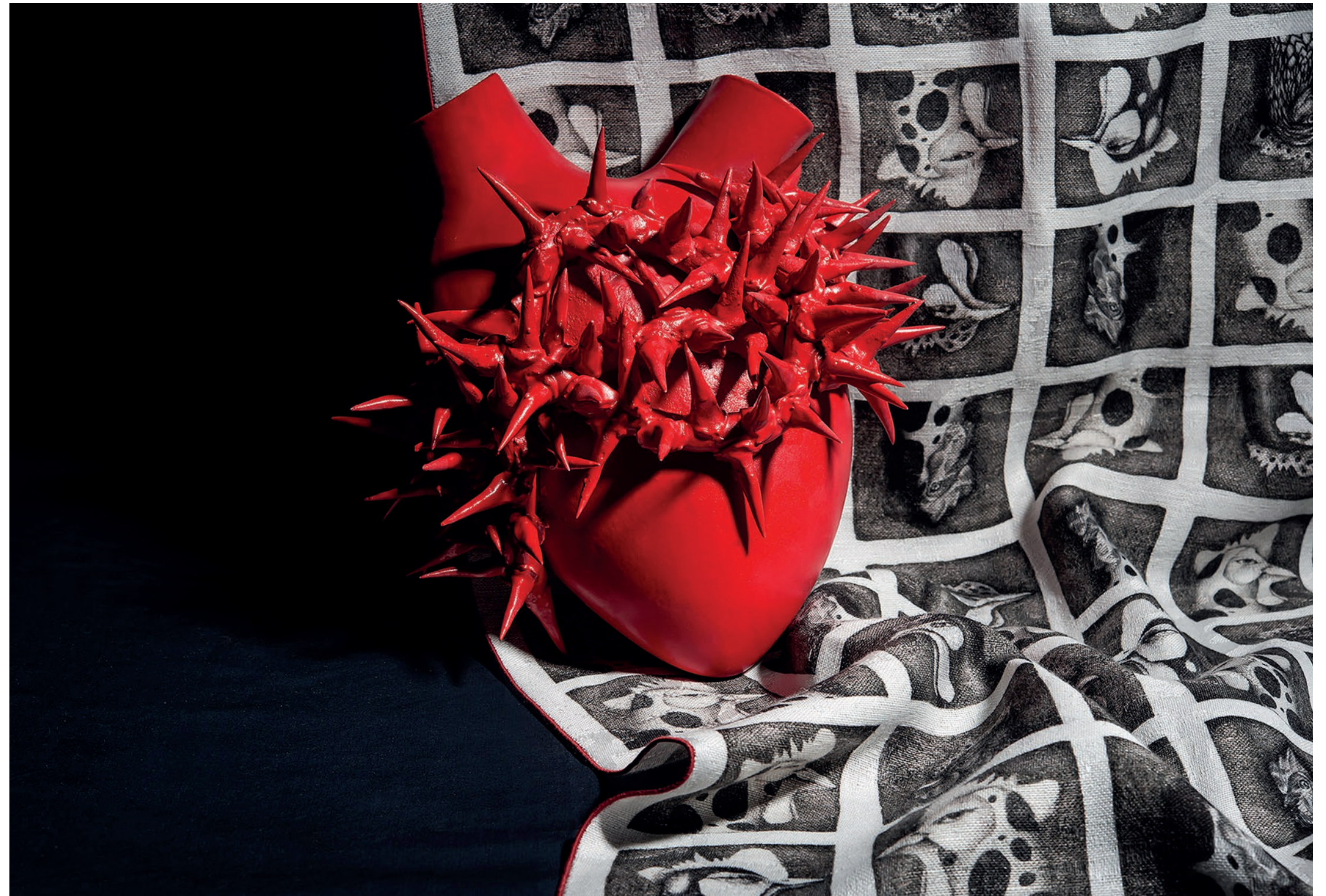
PASTORE E BOVINA - CUORE SPINAE - PORCELLANA E SMALTO ARCOLAIO - QUINTESSENZA, RUNNER AVICOLA - COTONE E LINO