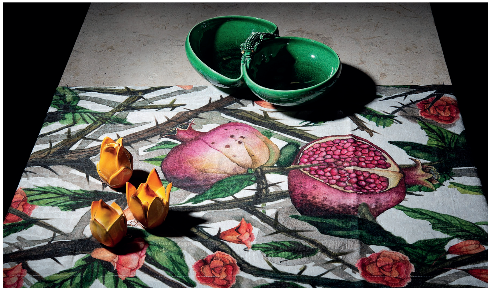
MIRTA MORIGI - CIOTOLA LUCERTOLA, FIORI - CERAMICA SMALTATA