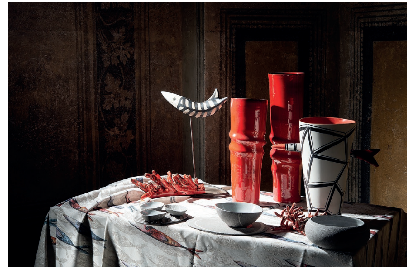
MIRTA MORIGI - Vasi rossi - MAIOLICA SMALTATA OPIFICIO CERAMICO ALFREDO GIOVENTÙ- CIOTOLE - PORCELLANA PASTORE E BOVINA - PESCE, CORALLO- GRÈS, FERRO PASTORE E BOVINA - Vaso dal PESCE TRAFITTO- PORCELLANA , SMALTI ARCOLAIO - QUINTESSENZA, TOVAGLIA NEMO - COTONE E LINO