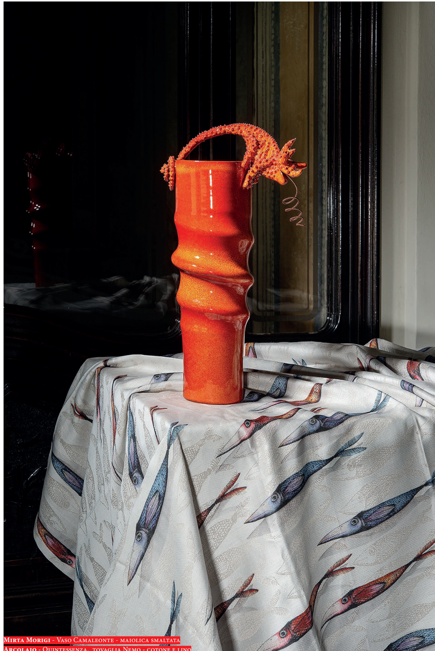
MIRTA MORIGI - Vaso CAMALEONTE - MAIOLICA SMALTATA ARCOLAIO - QUINTESSENZA, TOVAGLIA NEMO - COTONE E LINO