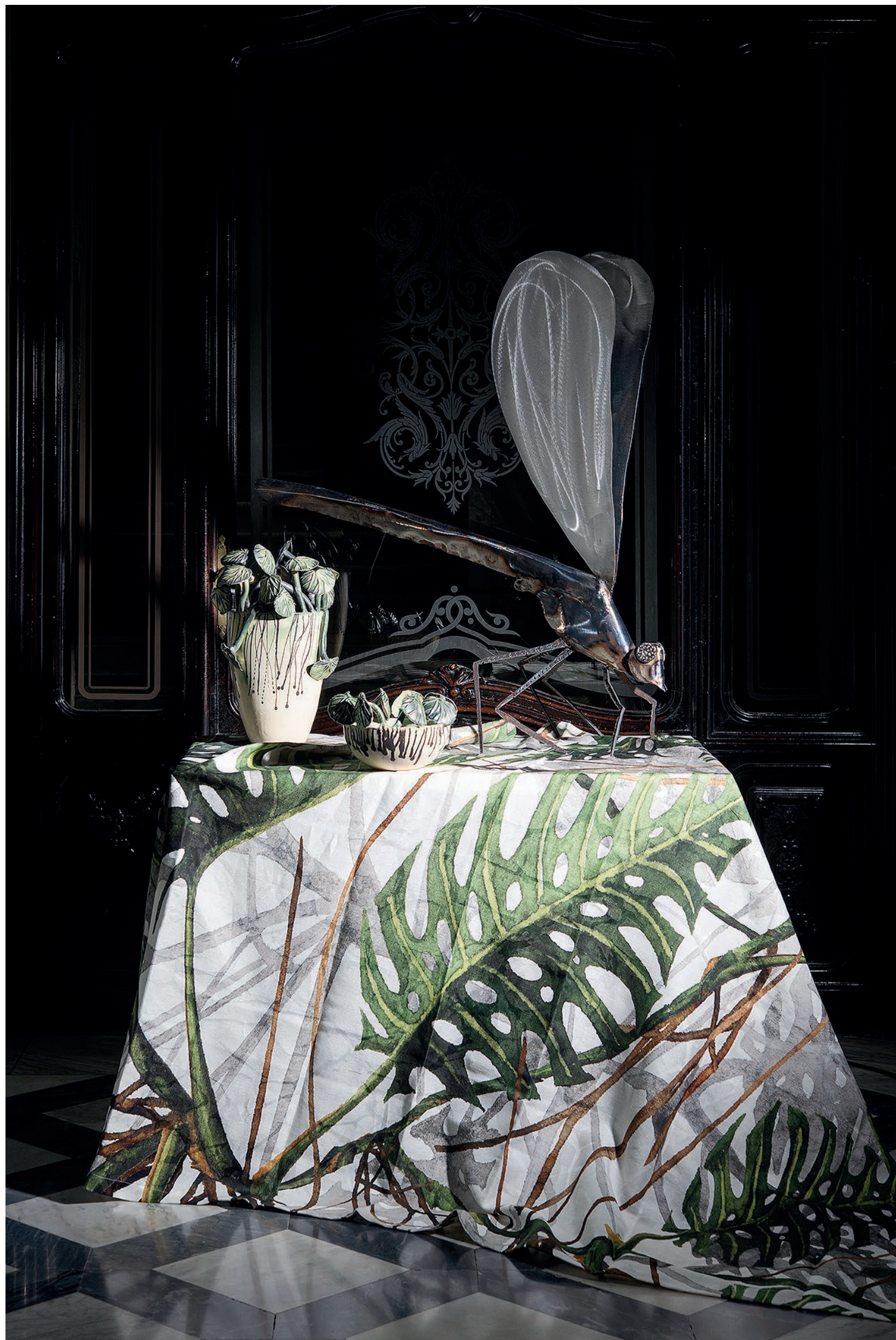
LINEA SEBASTIANO - LIBELLULA - FERRO PASTORE E BOVINA - NATURALIA - GRÉS E OSSIDI ARCOLAIO - QUINTESSENZA, TOVAGLIA MOSTERIA - COTONE E LINO