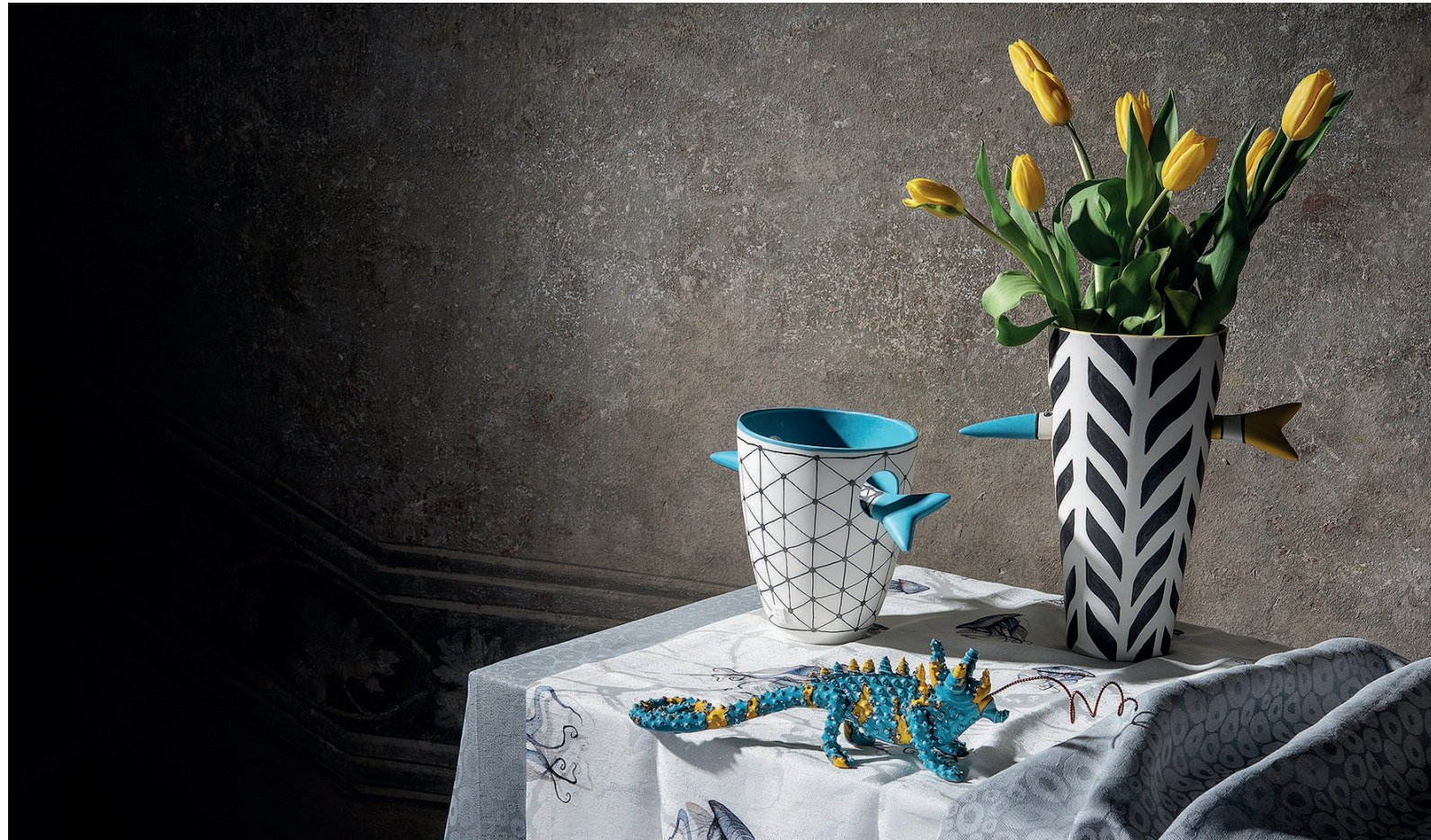
MIRTA MORIGI - CAMALEONTE - CERAMICA SMALTATA PASTORE E BOVINA - VASO DAL PESCE TRAFITTO - PORCELLANA, SMALTO ARCOLAIO - QUINTESSENZA, RUNNER MEDUSE - COTONE E LINO