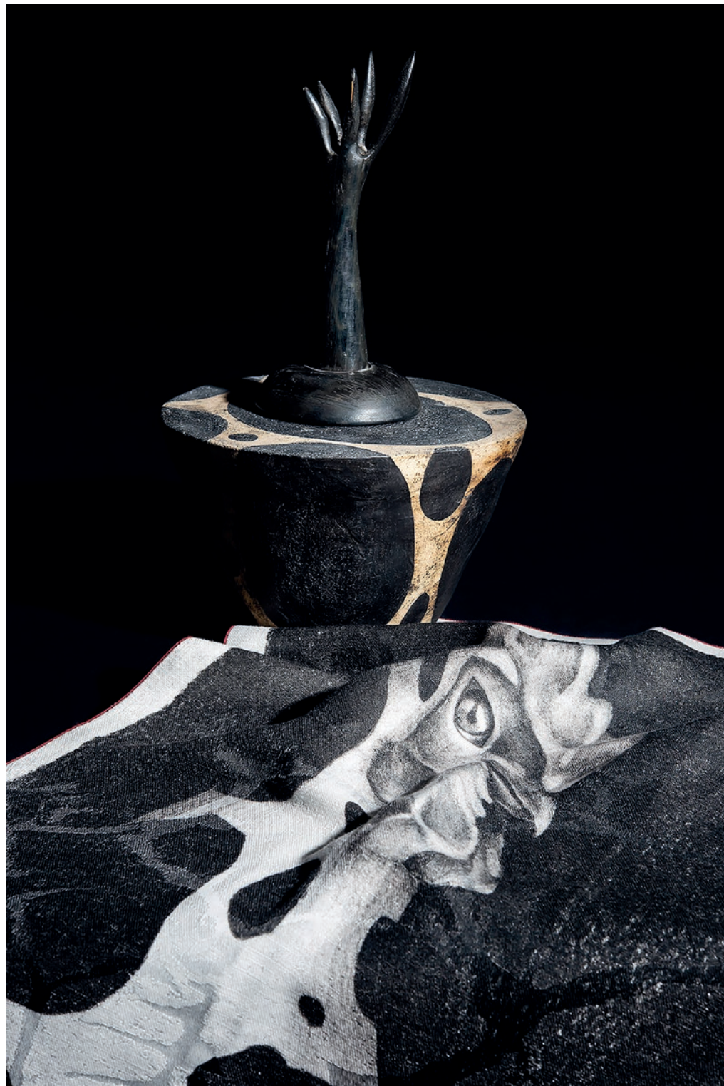
PASTORE E BOVINA - SCULTURA - GRÉS E LEGNO ARCOLAIO - QUINTESSENZA, CANOVACCIO AVICOLA - COTONE E LINO