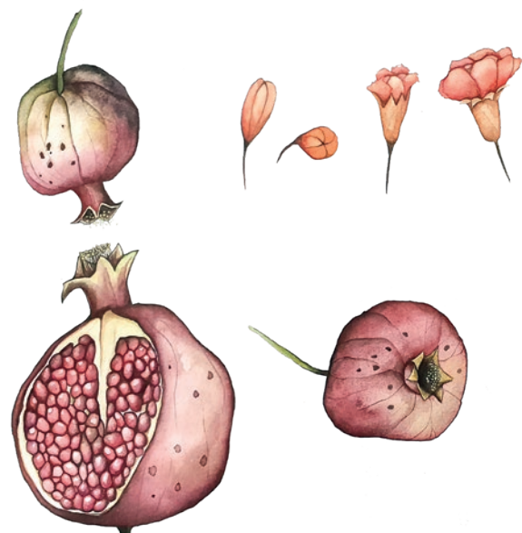
ARCOLAIO - QUINTESSENZA, RUNNER MELOGRANI - COTONE E LINO

melagrana s. f. [rifacimento del lat. malum granatum «mela granata» (v. lagg. granato 3 )] (pl. melagrane, raro melegrane). – 1. a. Il frutto del melograno (detto anche mela granata ): di forma sferica, con buccia coriacea di colore giallo che diventa rossastro a maturità, contiene numerosi caratteristici semi trasparenti, di color rosso rubino e di sapore acidulo. b. Ricorre spesso in similitudini: bocca, labbra di m.; rosso come un chicco di melagrana . 2. Nome con cui sono regionalmente chiamati, per il colore giallo rossastro, i granchi del genere calappa .