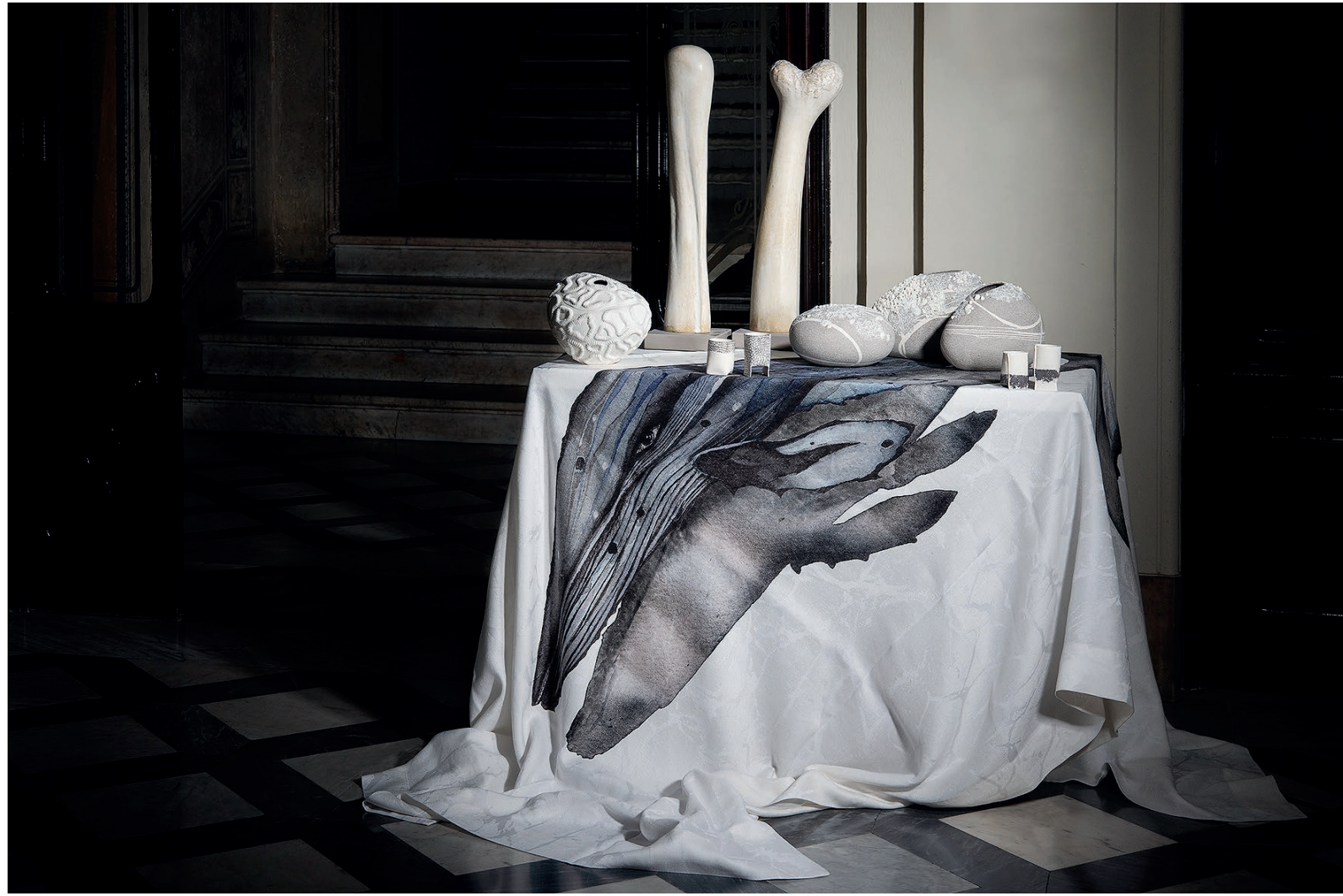
BIANCODICHINA - TAZZINE ORIGAMI - PORCELLANA ELISA CONFORTINI - BACULUM- GRÈS E MARMO OPIFICIO CERAMICO ALFREDO GIOVENTÙ - VASI SASSO - PORCELLANA ARCOLAIO - QUINTESSENZA, TOVAGLIA BALENA - COTONE E LINO