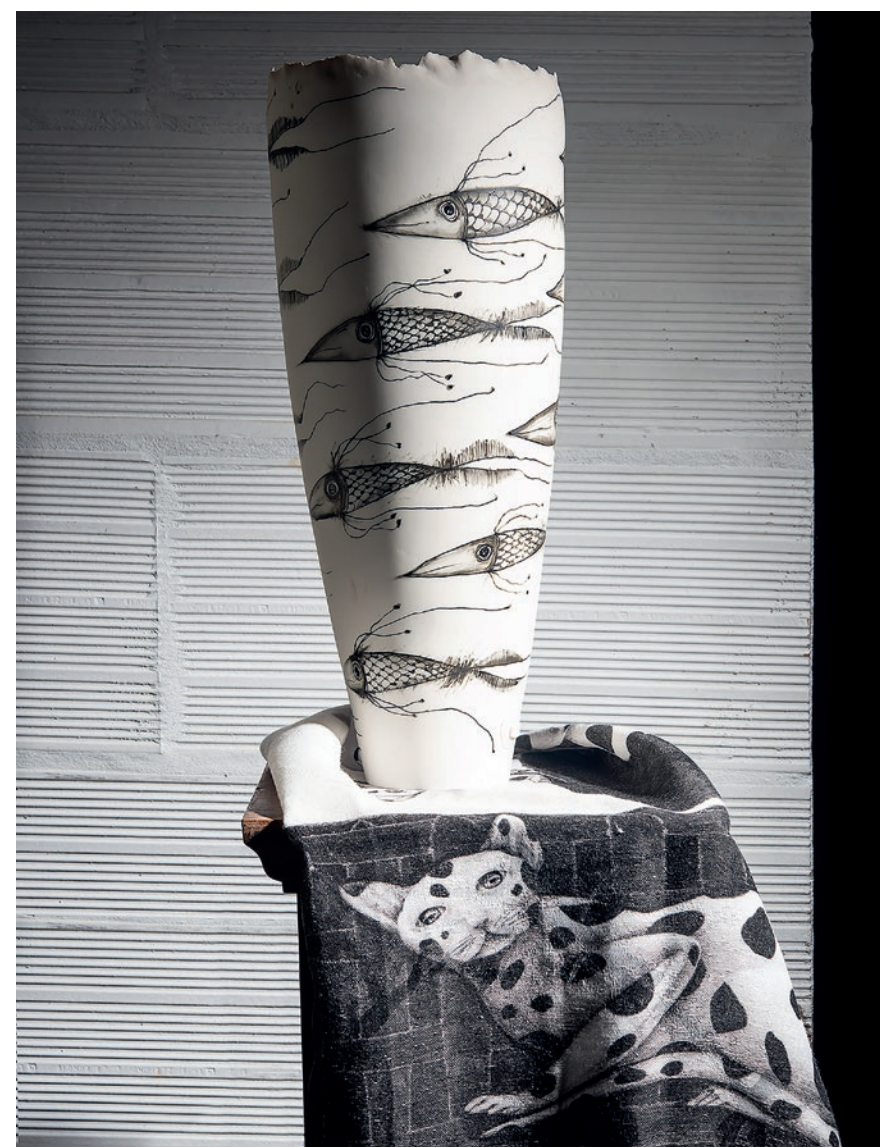
PASTORE E BOVINA - VASO PESCI - PORCELLANA DECORATA A PENNELLO ARCOLAIO - QUINTESSENZA, RUNNER FELINA - COTONE E LINO