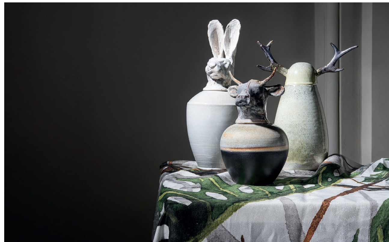
AMAARO - VASI CANOPI - CERAMICA SMALTATA ARCOLAIO - QUINTESSENZA, TOVAGLIA MOSTERIA - COTONE E LINO